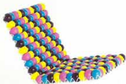
proj. Bashko Trybka