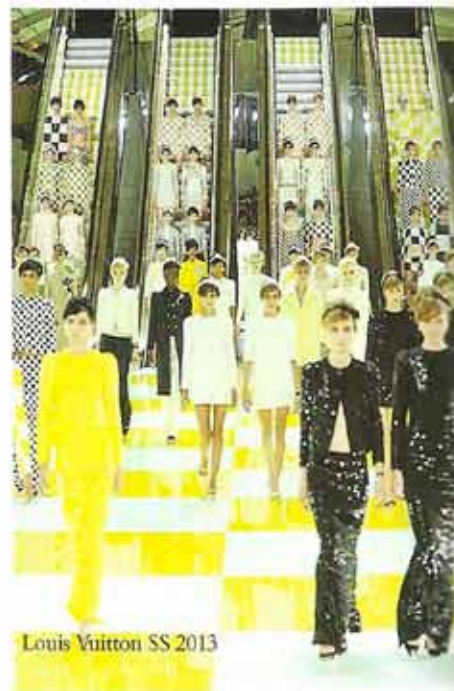
Louis Vuitton SS 2013