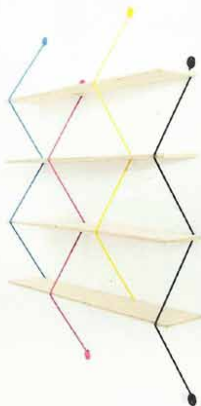
proj. Bashko Trybka