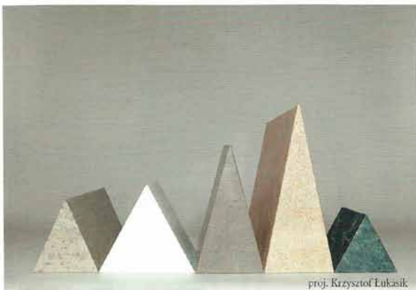
proj. Krzysztof Łukasik