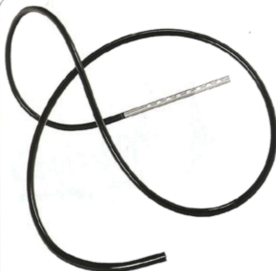
S7 LAMPE SERPENTINE

● Quoi : un tube flexible sur lequel s'adapte grâce à un système d'aimantation une tête de lampe interchangeable et orientable à 360°.